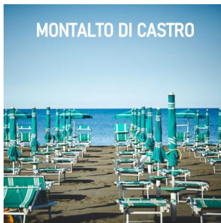
MONTALTO DI CASTRO