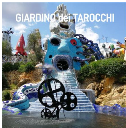
GIARDINO dei TAROCCHI